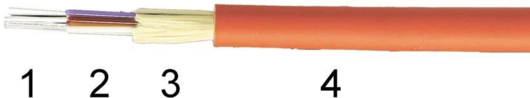
Figure 4: Câble CDI d'OPTRAL (DIN J-K(ZN)H12G)

Il est nécessaire alors de contraster leur construction avec les conditions requises, en ayant recours à la fiche technique correspondante: