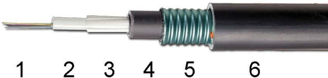
Figure 3: Câble DPESP-1 d'OPTRAL

Ainsi, un câble type PESP-R 8 x SM désignerait un câble étanche avec une double gaine en PE, structure loose, avec une armature en acier, et 8 fibres optiques SM