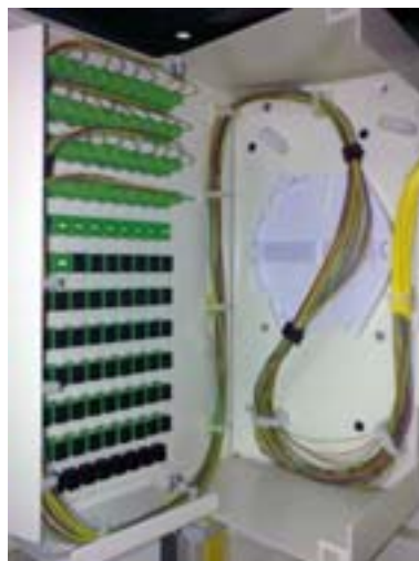
Panneaux de brassage et câbles pré-connectés