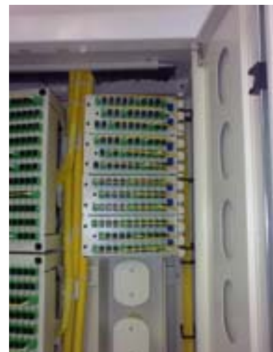
Panneaux de logement pour splitters