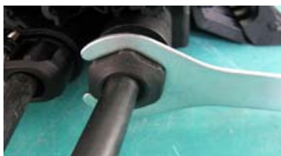
Clé pour presse étoupe