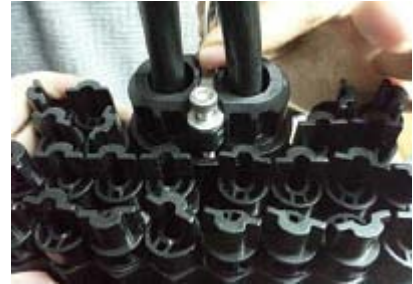
Entrées de câbles de raccordement.