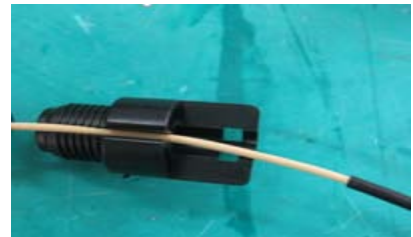
Écrou pour raccordement