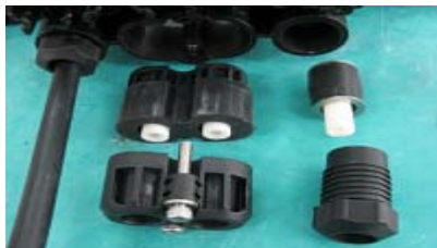
Obturbateur et presse étoupe