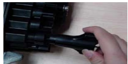
Clé pour écrou de raccordement