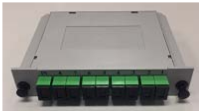
Cassette pour splitter